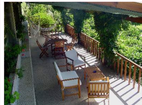
Exterior facilities at guests disposal