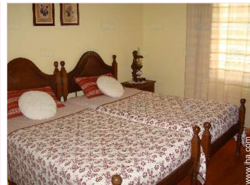
The guest room