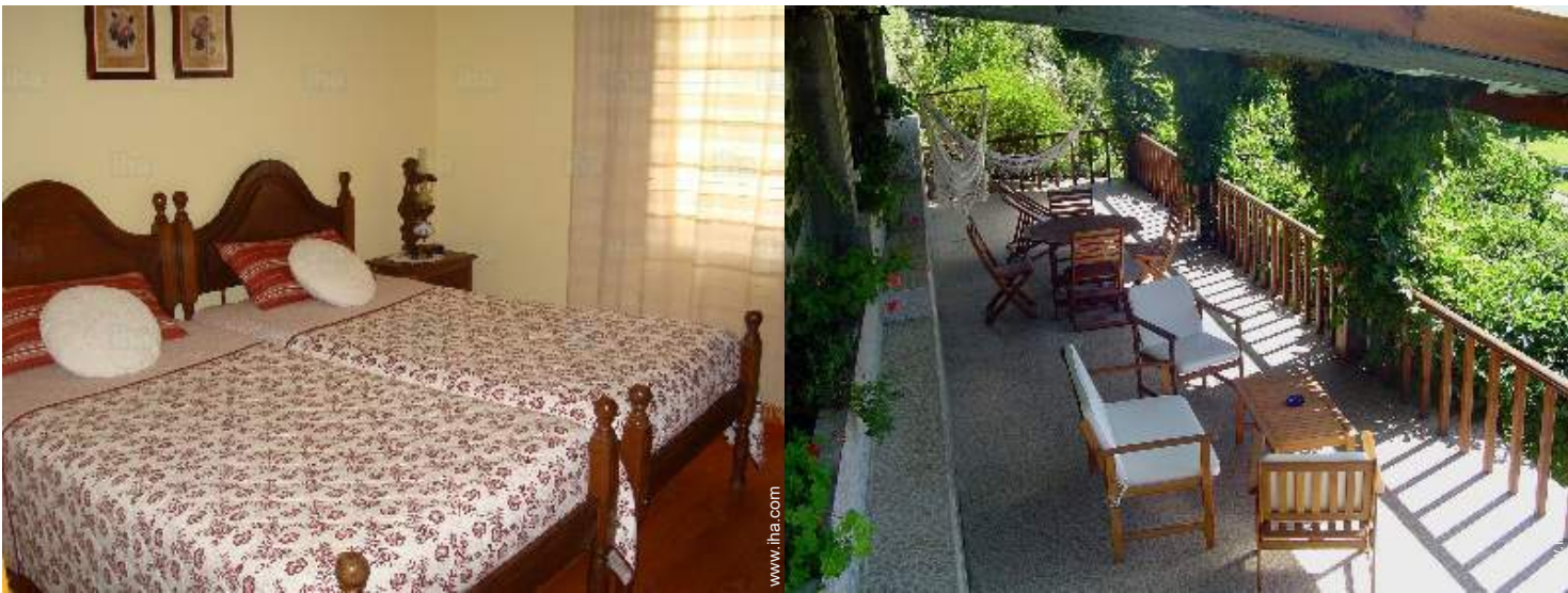
The guest room